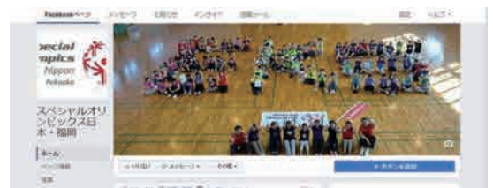
フェイスブックトップ画面