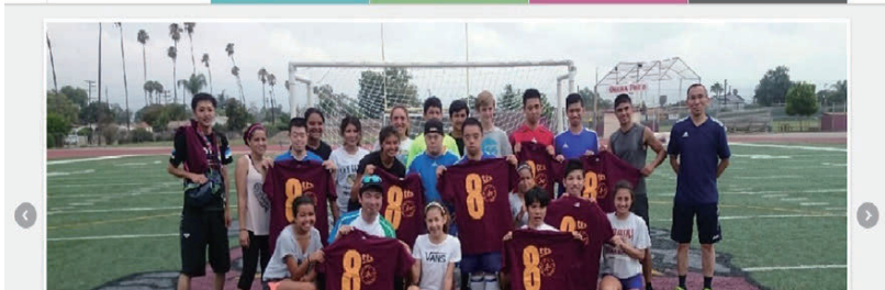
公式ホームページトップ画面