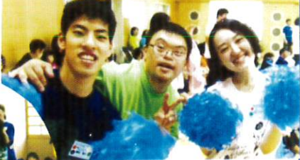
最後はみんなで作って来履の方をお見送り