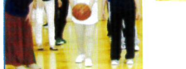
遠くへとばせよう