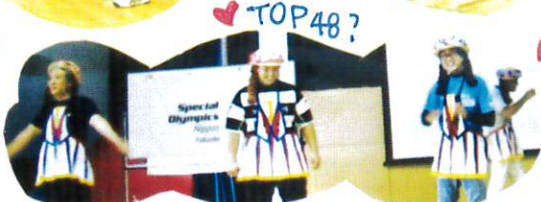
おかりのたいそう・恋するフォーチュンクッキー