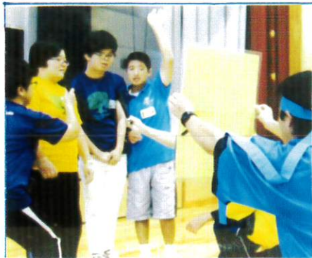
アスリート・選手宣誓