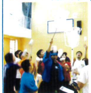
じゃまじゃま玉入れ