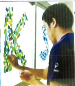
E・K・Sの文字に みんなでシールはり封