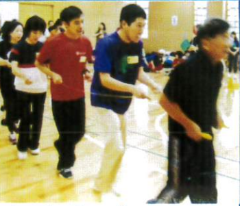
トレイントレイン