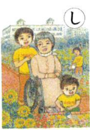
し 親切は ばくにもできる ボランティア