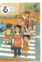
る ルールを守り 安全快適 明るい町に