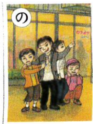
の ノーと言う 心の勇気が 大事だよ