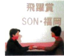
飛躍賞 SON・福岡 3月31日(日) 全国代表者会議 にて、SON・福岡が 飛躍賞を受賞しました