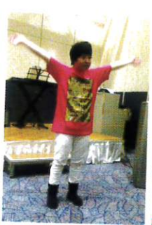
ダンスも キレッキレ!!