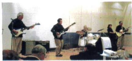
おやじバンド カッコ 良かったです