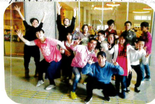
1月6日(日) 『笑顔と絆のスクラムpart5』 バリアビュー〜障がい者価値へ変える〜 というイベントで練習の 成果を発表 しました