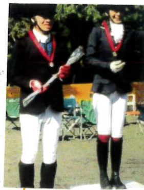
2月9日(土)~10日(日) SON・神奈川の地区大会に 馬術プログラムが 参加 しました!