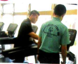
マシンは 本格的二女