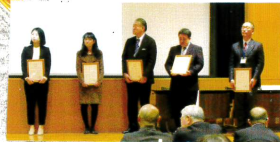
いつもご支援 ありがとうございます ごさい ます

2019年度通常総会が行われました。 総会終了後は感謝状贈呈式が行われ ました。出席された皆様お疲れ様でした。