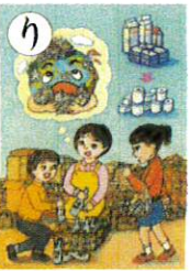
り リサイクル ゴミから資源を つくり出す