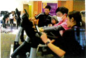
トレーナーさんの指導の下 親子でワイワイとっても 楽しかったそうです。