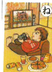
ね 寝ころんで お菓子とゲームで 肥満体